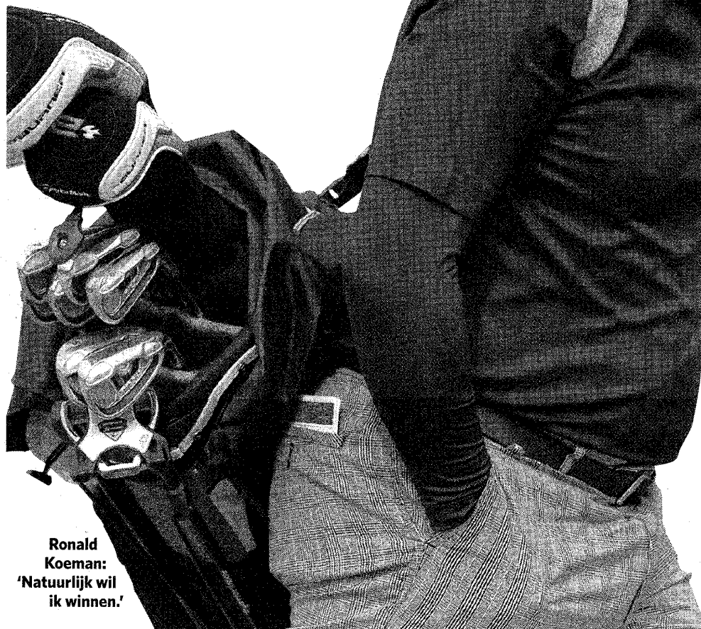
Ronald Koeman: 'Natuurlijk wil ik winnen.'